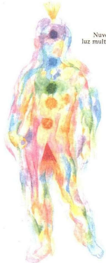
Nuvens de luz multicolorida