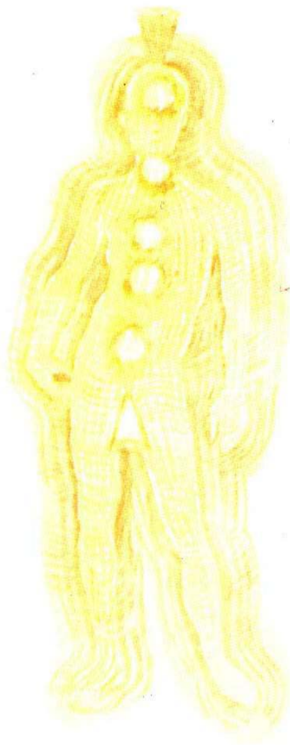
Linhas de luz amarela

Estende-se além do corpo emocional e se compõe de substâncias ainda mais finas, associadas a pensamentos e processos mentais. Quase todo amarelo, pode-se ver dentro dele formas de pensamento que parecem bolhas de brilho e forma variável. Pensamentos habituais tornam-se forças “bem-formadas” muito poderosas, que depois exercem influências em nossa vida. Portanto gerencie seus pensamentos e evite coisas negativas, pois tudo que pensamos é energia que estamos movimentando, com resultados positivos ou não.